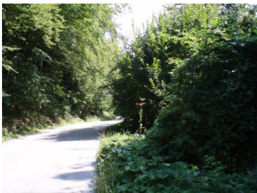
Slika 4. Zaraščena zmanjšuje vidnost

Očiščene brežine (cestni bregovi in robovi) pripomorejo k boljši vidnosti, s tem pa varnosti otrok. Ugotavljamo, da so v tem šolskem letu občutno bolj pogošene in očiščene. Kljub temu smo opazili mesta, ki so pretirano zaraščena (malomarno vzdrževana), spisek le teh pa posredovali Komisiji za tehnično urejanje prometa občine Kamnik. Hkrati naprošamo krajanke, da očistijo obcestne robove, ki mejijo na njihova zemljišča, da redno vzdržujejo žive meje, jih obrezujejo na ustrezno višino, da tako pripomorejo boljši preglednosti cest in večji varnosti otrok.