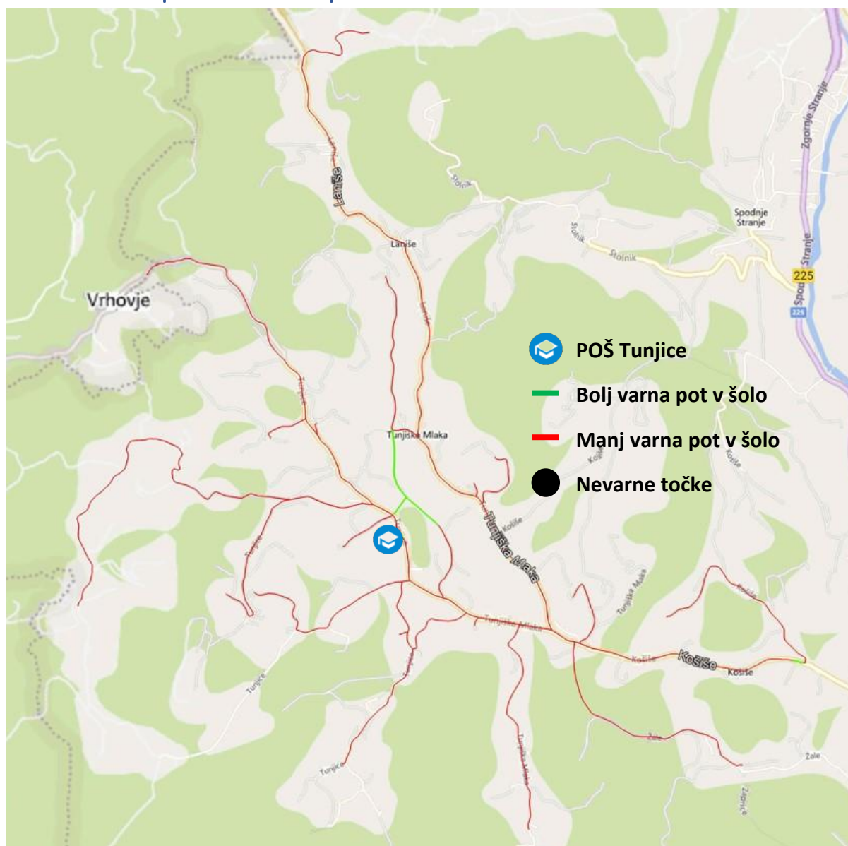
Slika 1. Grafični prikaz šolskih poti podružnične šole Tunjice

Na Sliki 1 je prikazan grafični prikaz šolskih poti učencev od 1.–5. r ki obiskujejo podružnično šolo Tunjice.