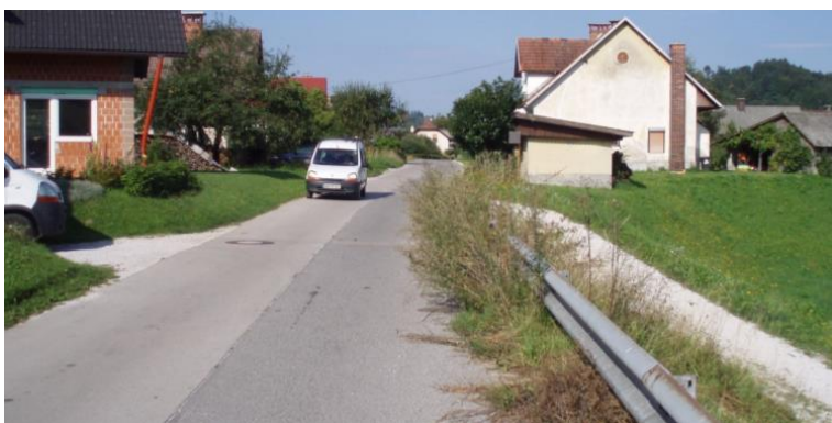
Slika 6. Pešec (kolesar) je primoran hoditi (voziti) v vozišče več kot 1 m od roba, očistiti vozišče ali postaviti oznako zoženje vozišča

V preteklem obdobju smo uspešno sodelovali s Svetom za preventivo in vzgojo v cestnem prometu in Komisijo za tehnično urejanje prometa občine Kamnik in zadovoljni opažamo, da so rešili številne naše predloge, da strokovno načrtujejo in izvajajo dela, ki pripomorejo varnosti naših otrok. Neurejene razmere na posnetkih so v večini primerov že rešene, posnetki so iz starejšega obdobja, objavljamo jih le za predstavitev problema in za opomin.