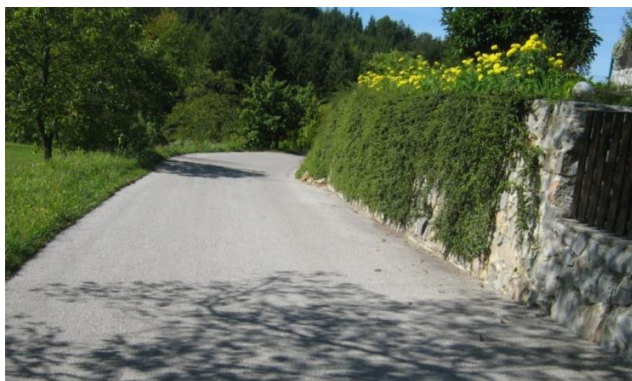
Slika 2. Primer nepreglednega ovinka, pešec nima možnosti umika iz vozišča

Otroci naj hodijo po tisti strani ceste, kjer so bolj vidni, opazni, oz. se lahko umaknejo z vozišča. Za pešce velja prometno pravilo, da se izven naselja hodi po levi strani vozišča. Žal to priporočilo ni vedno najbolj varno. Če je cesta npr. vsekana v brežino, potem prihaja ob brežini do nepreglednih ovinkov in je praviloma zunanja stran ovinka bolj pregledna in omogoča umik iz vozišča. V praksi se pogosto pokaže, da je določena stran ceste ponavadi varnejša za hojo v obe smeri (zunanja stran ceste, ki ni usekana v brežino).