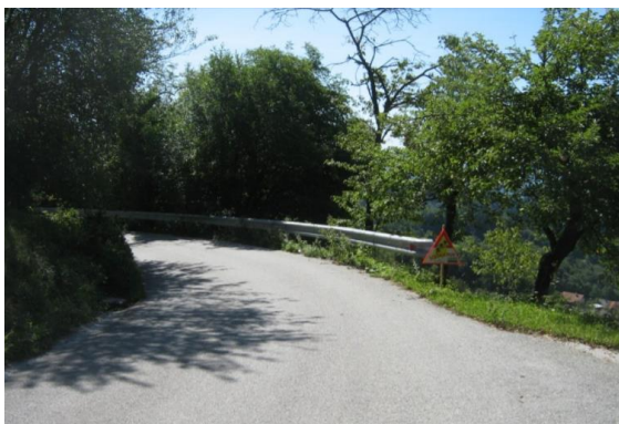
Slika 3. Kaj naj priporočamo otroku, po levi ali desni strani?

Vsak starš je dolžan z otrokom prehoditi šolsko pot in otroka poučiti o vseh nevarnostih in pravih ravnanjih na poti v šolo in domov. Otroci hodijo domov v skupinah, pogosto prihaja do hoje v gručah ali v paru. Tega ne moremo preprečiti, moramo pa jih poučiti, da na nepreglednih ovinkih in na cestiščih brez možnosti umika iz vozišča, če je le mogoče uporabijo pot izven vozišča (daljšo, tudi napornejšo pot) oz. da obvezno hodijo v gosjem redu, po skrajnem robu vozišča. Ko zaslišijo avto, naj se obvezno umaknejo z vozišča.